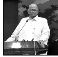
श्री. शरद पवार