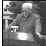
श्री. हमीद अन्सारी