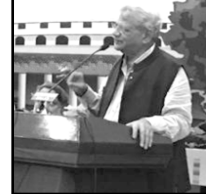
कों. सीताराम येचुरी